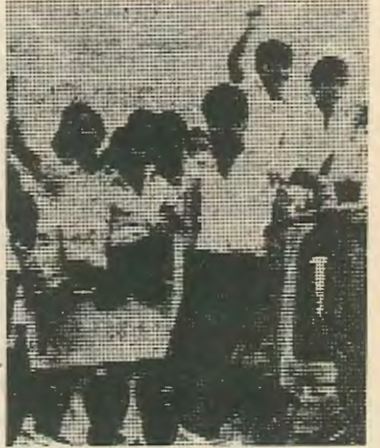
έχει επικοινωνία με τον κύριο δρόμο. Ο κύριος δρόμος απέχει από το χωριό περί το 1 μίλι. Έτσι μόνο με αυτο το μέσο μπορούν να μεταφερθούν στο σχολείο και τους εκβιάζουν με την αύξηση των κομιστρών.

Μας είπαν σχετικά οι μαθητές. — Οι λεωφορειούχοι το κάνουν αυτό διότι το Παλιομέτοχο είναι ένα χωριό 4500 χιλιάδων κατοίκων. Δεν